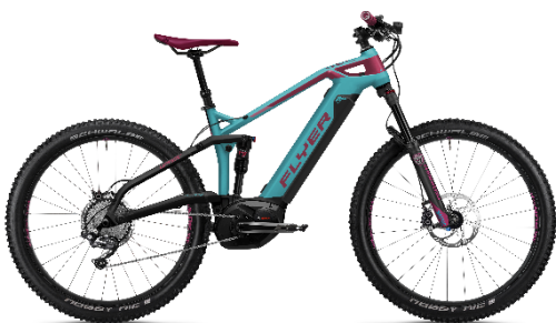
FLYER Uproc3 "Heidi"