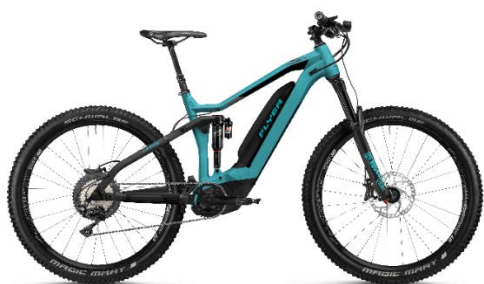
FLYER Uproc7 avec nouveau moteur Panasonic

Pour les sportifs qui profitent aussi de leur e-mountainbike sur la route, FLYER propose également un vaste choix de modèles entièrement équipés. Avec ses nouveaux modèles « Heidi » aux couleurs raffinées (Aubergine/Berry ou Glacier Blue/Berry, ...), FLYER a pensé tout spécialement aux pratiquantes d'e-mountainbike.