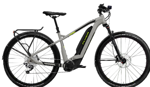
FLYER Uproc2 entièrement équipés