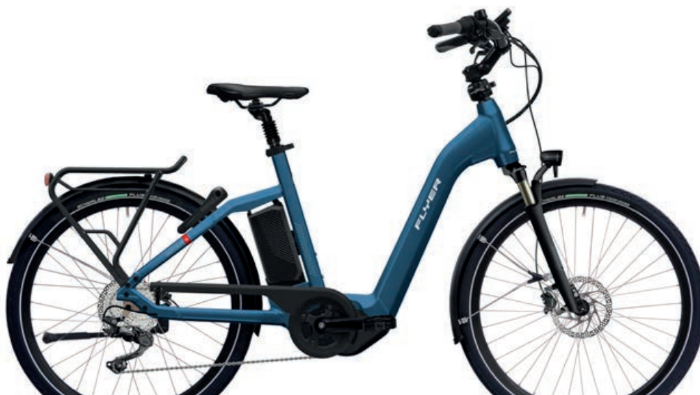
Gotour4 7.10 Jeans Blue Gloss