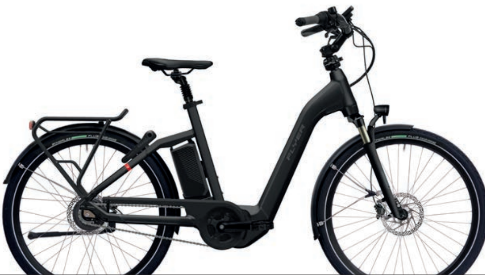
Gotour4 5.00 Pearl Black Gloss

Produktabbildungen können von den Spezifikationen abweichen. Farben können abweichen.