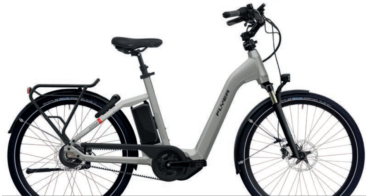
Gotour4 723 Cast Silver Gloss

Das Gotour4 ist das Schwestermodell des Gotour5 und am liebsten in Gesellschaft durch abwechslungsreiche Landschaften unterwegs. Mit kleineren 26 Zoll Laufrädern ist es besonders agil und handlich. Rahmengrößen in XS und S sowie der tiefe Einstieg machen das Gotour4 zum idealen E-Bike für kleinere Fahrerinnen und Fahrer. Ob die aufrechte Sitzposition, der höhenverstellbare Lenker mit Speedlifter oder der bequeme Sattel – das Gotour4 ist konsequent auf Komfort ausgerichtet. Gepaart mit dem kräftigen und harmonisch unterstützenden Panasonic Motor und dem kapazitätsstarken, auf hohe Reichweite ausgelegten Akku sorgt das Gotour4 für endlosen Fahrgenuss. Das Gotour4 bietet Wellness mit Fahrtwind.