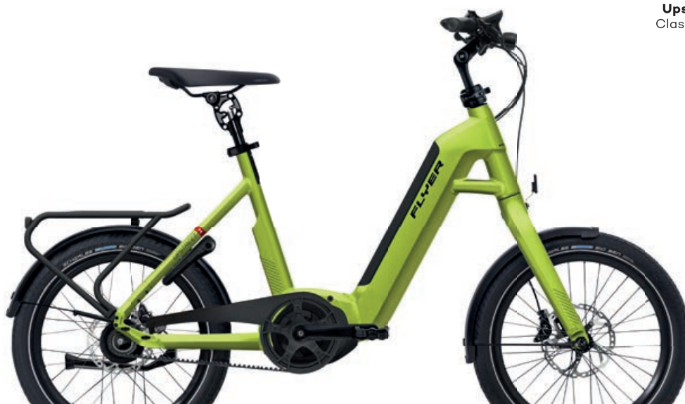
Upstreet1 743 Lime Green Gloss

Le immagini dei prodotti possono differire dalle specifiche. I colori possono differire da quelli raffigurati.