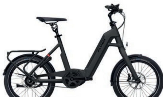
Upstreet1 743 Black Matt

Perfettamente adatta alla vita cittadina, la Upstreet1 mostra tutta la sua vera grandezza negli spazi ristretti. Di dimensioni compatte e dal design vivace, questa straordinaria e-bike coniuga la mobilità urbana al divertimento di guida. Nonostante le ruote compatte da 20 pollici e la grande agilità, la Upstreet1 sorprende per l'eccezionale stabilità e convince anche sui lunghi percorsi con il comfort tipico dei modelli FLYER. Il motore supersilenzioso Bosch consente al bolide cittadino di attraversare le strade cittadine pressoché in totale silenziosità. La Upstreet1 segue lo slogan «Una per tutti» – quest'e-bike one-size si adatta infatti a chiunque sia alto tra i 150 e i 190 centimetri. La Upstreet1 offre agile mobilità in qualsiasi situazione.