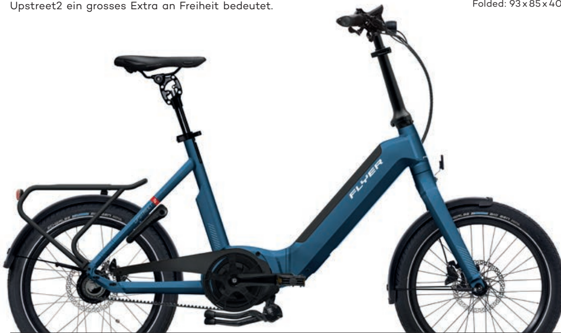
Upstreet2 7.43 Jeans Blue

Produktabbildungen können von den Spezifikationen abweichen. Farben können abweichen.