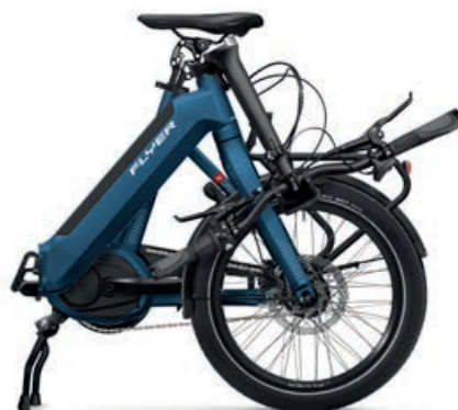
Upstreet2 5.00 Folded: 93x85x40 cm

Per una vacanza in campeggio o coi trasporti pubblici nel tragitto quotidiano casa-lavoro: è negli spazi ristretti che la Upstreet2 mostra tutta la sua grandezza. Pieghevole e compatta, la bicicletta non lesina comunque nelle caratteristiche di guida: grazie all'intelligente giunto pieghevole con doppio meccanismo di sicurezza e allo stabile telaio la Upstreet2 convince per la stabilità di guida e il comfort sorprendenti. Le agili ruote da 20 pollici e l'armonioso motore Bosch garantiscono il massimo piacere di guida all'insegna della dinamicità. La Upstreet2 segue lo slogan «Una per tutti» – quest'e-bike one-size si adatta infatti a chiunque sia alto tra i 150 e i 190 centimetri. Sono davvero tante le occasioni in cui la piccola Upstreet2 è sinonimo di maggiore libertà.