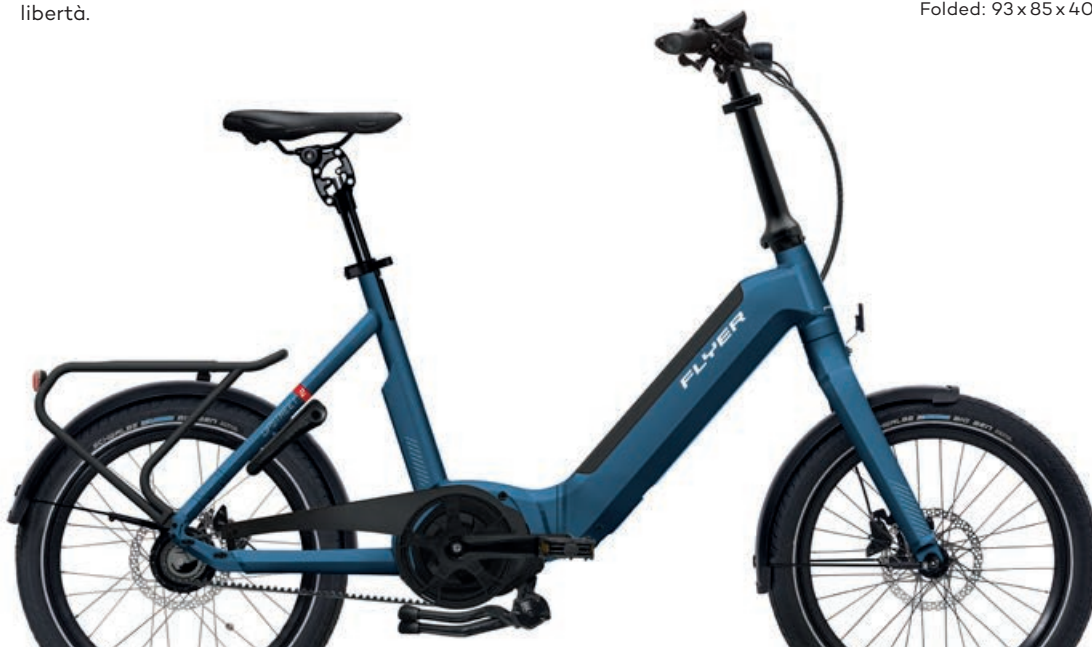
Upstreet2 7.43 Jeans Blue

Le immagini dei prodotti possono differire dalle specifiche. I colori possono differire da quelli raffigurati.