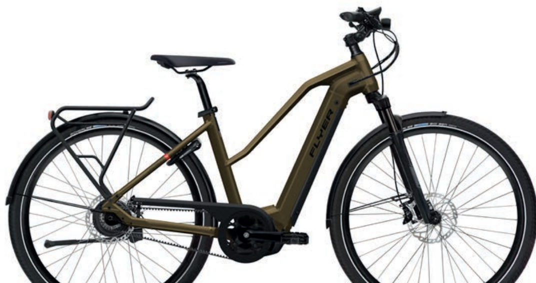
Upstreet4 723 Vintage Brass Gloss, Mixed

Le immagini dei prodotti possono differire dalle specifiche. I colori possono differire da quelli raffigurati.