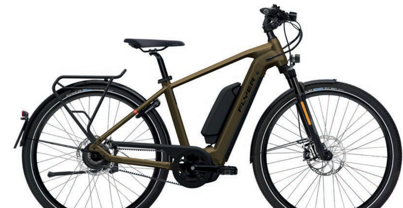
Upstreet4 7.83 Vintage Brass Gloss, Gents

La Upstreet4 è sempre in movimento ed è la compagna ideale per affrontare la giungla urbana. L'instancabile fondista non solo fa sentire bene, ma fa fare anche bella figura a tutti. A scelta con due batterie e con una capacità massima di 1'125Wh, quest'e-bike sportiva destinata ai pendolari raggiunge nuovi record di autonomia. Il più potente motore Bosch e i pregevoli allestimenti sottolineano l'orientamento di quest'e-bike di altissimo livello per ciclisti regolari ed e-biker esigenti. La posizione di seduta sportiva ma comoda al tempo stesso ed il telaio silenzioso garantiscono il massimo comfort sulle lunghe distanze. Per arrivare al lavoro in un lampo, la Upstreet4 è disponibile anche in versione High Speed con sistema di pedalata assistita della velocità massima di 45km/h. Per la Upstreet4 i percorsi non sono mai abbastanza lunghi.