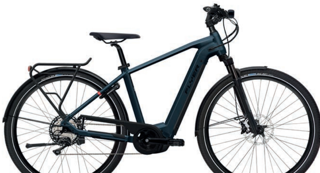
Upstreet4 770 Space Blue Gloss, Gents