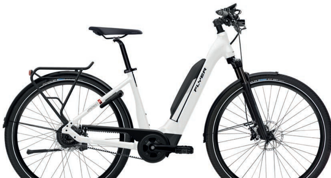
Upstreet5 7.83 Pearl White Gloss, Comfort

Su strada, per recarsi rapidamente al lavoro, per una deviazione su di una strada di campagna – con la Upstreet5 la mobilità elettrica è sempre una scoperta! Un potente motore Panasonic, la geometria equilibrata e le stabili ruote con pneumatici larghi garantiscono comfort di guida e sicurezza. Innovazioni intelligenti, come i comandi particolarmente intuitivi del display a colori e del motore – a scelta addirittura con cambio completamente automatico – e la trasmissione a cinghia che richiede poca manutenzione assicurano un piacere illimitato di guida. La Upstreet5 non accetta limiti quando si tratta di dotazione e componenti. La Upstreet5 è disponibile nella versione High Speed con sistema di pedalata assistita fino a 45km/h o nel modello speciale 7.12 XC con pneumatici da mountain-bike per migliori doti offroad. Con la Upstreet5 la vita quotidiana si trasforma in tempo libero.