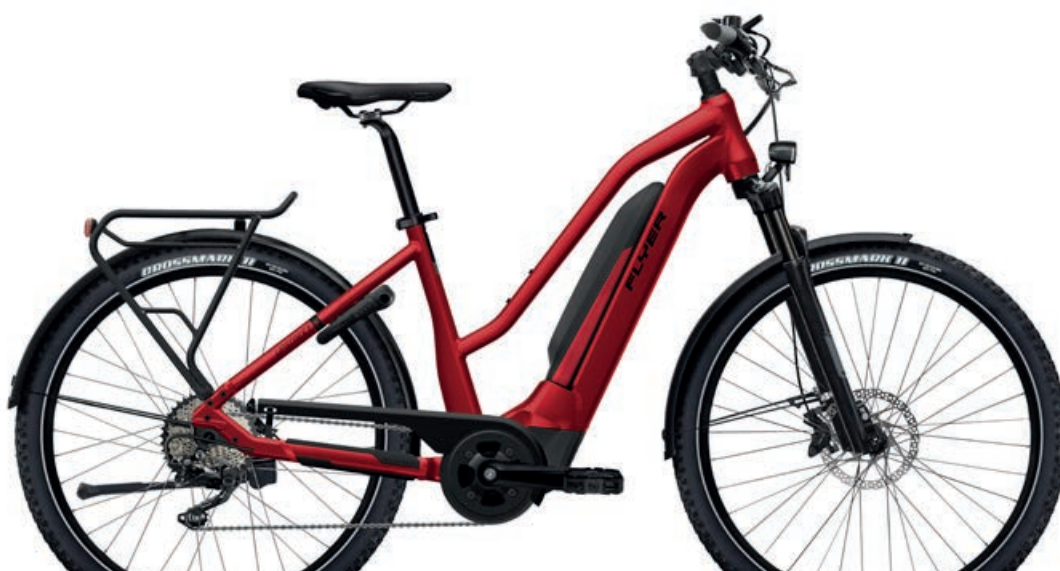
Upstreet 5 7.12 XC Mercury Red Gloss, Mixed