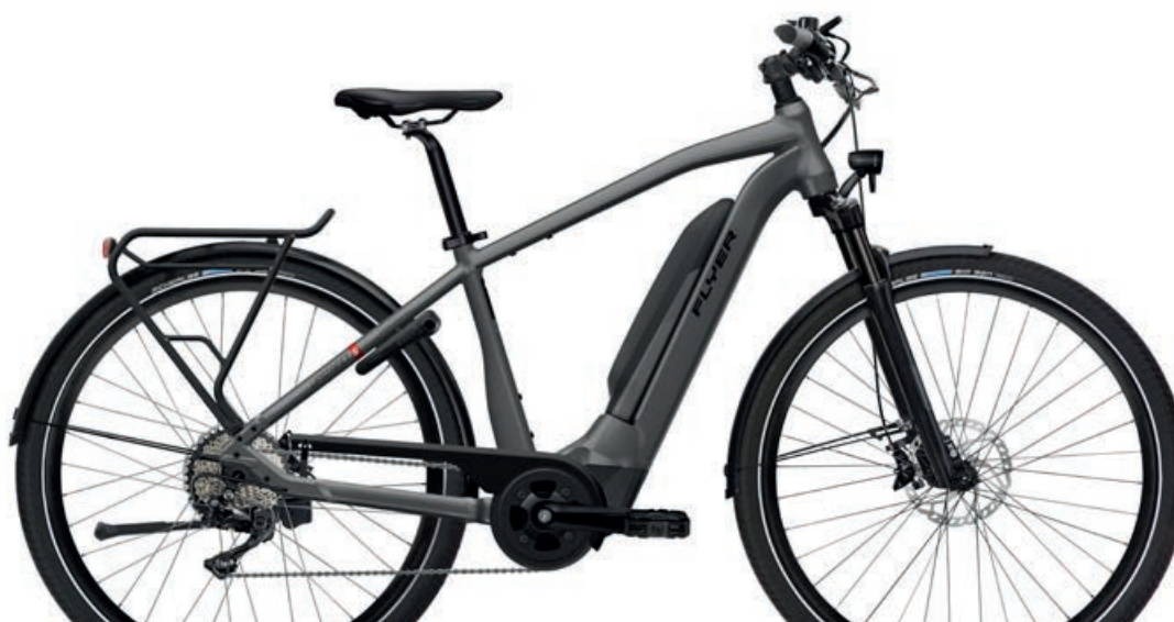
Upstreet 5 7.10 Anthracite Gloss, Gents

Le immagini dei prodotti possono differire dalle specifiche. I colori possono differire da quelli raffigurati.