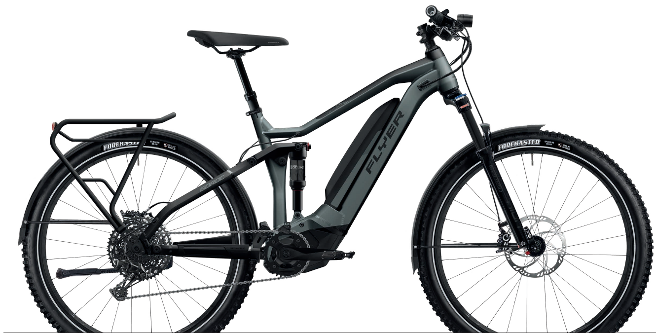
Goroc4 Black Shading / Black Gloss

Of u nu dagelijks naar het werk rijdt, een toer in de vrije tijd maakt, of er een heel weekend met een bepakte fiets op uittrekt: de Goroc4 is telkens de passende fiets. De sportieve mountainbikegenen, Panasonic-motor met slimme FLYER-bediening en hoogwaardige afwerking maken de Goroc4 tot een ultieme allrounder. De goed reagerende vering met 140 millimeter veerweg zorgt ook op ruige trails en bij hoge snelheden voor veel tractie, comfort en veiligheid. De Goroc4 is ook verkrijgbaar in een high-speeduitvoering met pedaalondersteuning tot 45 kilometer per uur. De Goroc4 is uitgerust voor stadsgebruik en gebouwd voor het avontuur.