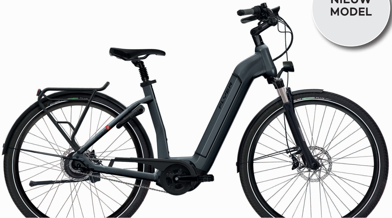
Gotour2 Gen2 5.00 Anthracite Gloss

Productafbeeldingen kunnen van de specificaties en kleuren afwijken.