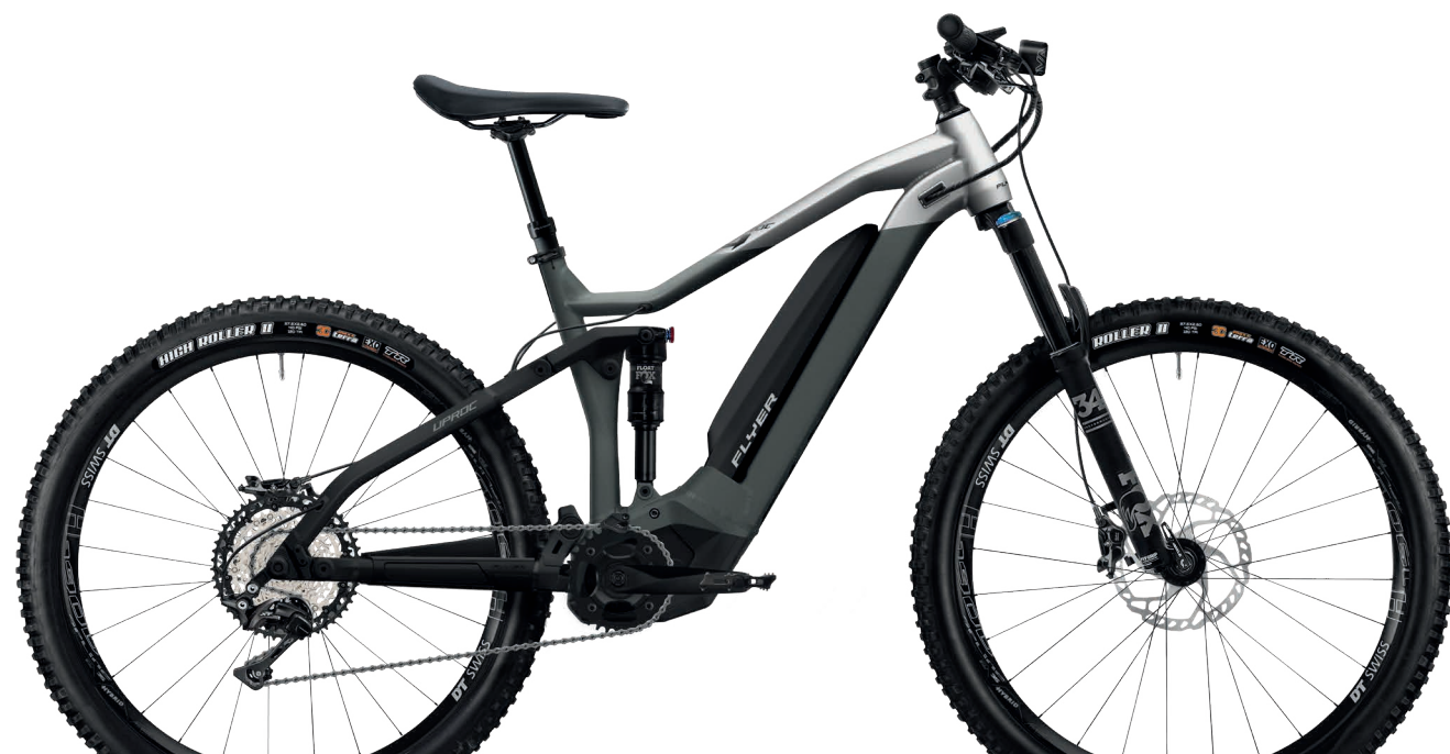
Uproc4 Black Shading / Cast Silver Matt

De Uproc4 is de ideale e-fully voor e-mountainbikers die op zoek zijn naar een veelzijdige fiets voor verschillende terreinen. Met zijn 140 millimeter veerweg en 27,5"-banden met maximale grip is hij op uitdagend terrein bijna net zo robuust als het vlaggenschip van de Uproc-serie, de Uproc7. Op gematigde paden is hij zelfs nog een fractie wendbaarder. Dankzij de Panasonic GX Ultimate motor, die slechts 2,9 kilogram weegt, biedt de Uproc4 krachtige, harmonieuze ondersteuning, ook op de steilste hellingen. De slim geïntegreerde accu met grote capaciteit (723 wattuur) biedt meer dan voldoende energie voor langere tochten met vele hoogtemeters. Zonder twijfel is de Uproc4 de ideale reisgenoot voor degenen die graag nieuwe omgevingen ontdekken.