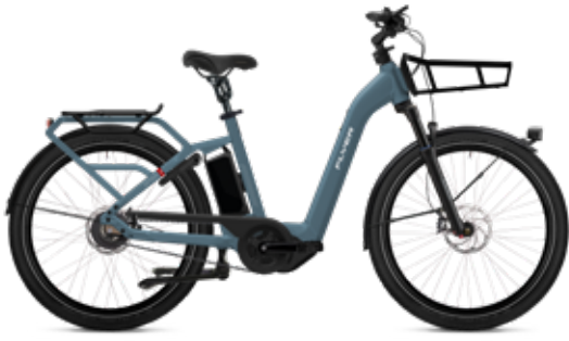
7.43 Pigeon Blue Gloss