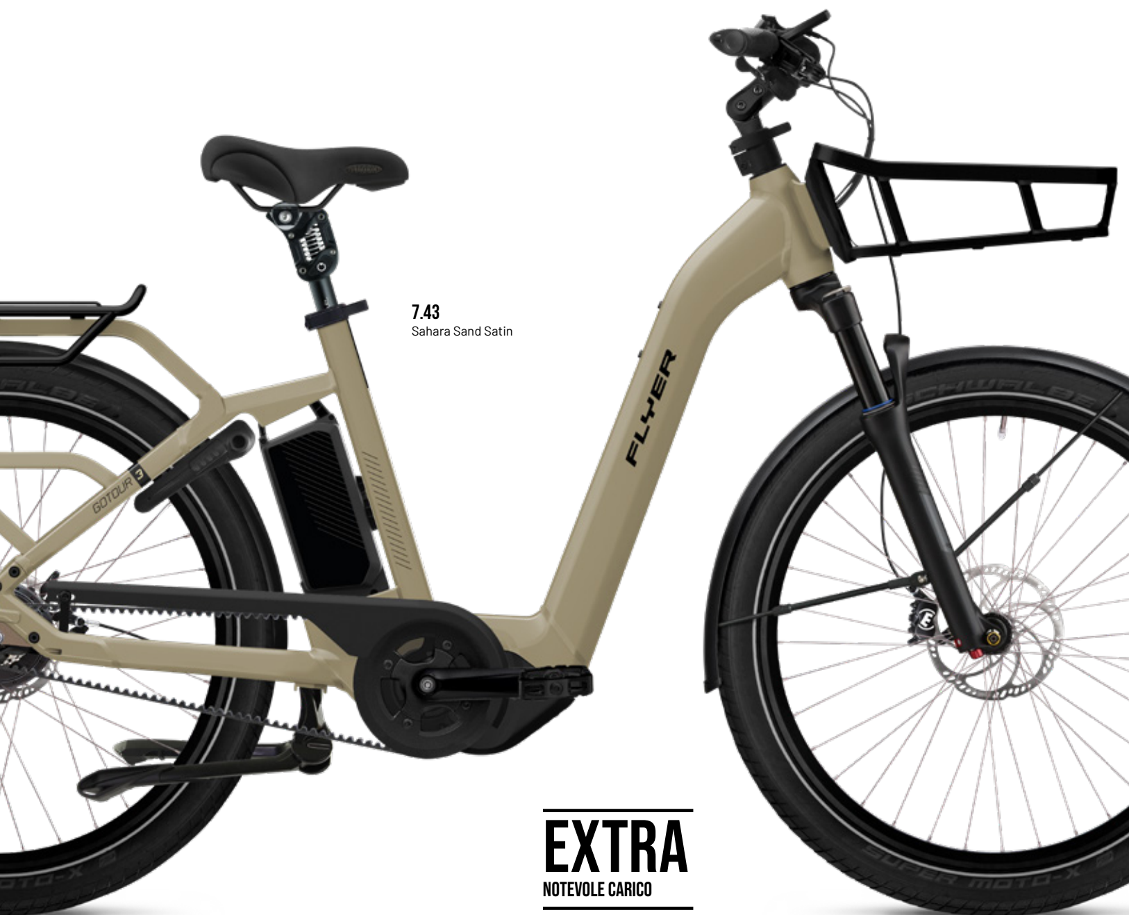
7.43 Sahara Sand Satin

per il fissaggio sicuro del giunto ai carrelli porta bimbo. Ideali per tutta la famiglia sono anche il semplice accesso alla batteria, gli elementi di comando FIT applicati in modo ergonomico e il display di grandi dimensioni. Il cambio nel mozzo Nexus a 5 velocità di Shimano, particolarmente robusto, è perfettamente armonizzato con i carichi particolarmente elevati del potente motore centrale e garantisce la massima resistenza e un rapido cambio di rapporto. Per una durata ancora maggiore, il cambio nel mozzo è combinato con la trasmissione a cinghia «Gates Carbon Drive» a ridotta manutenzione.